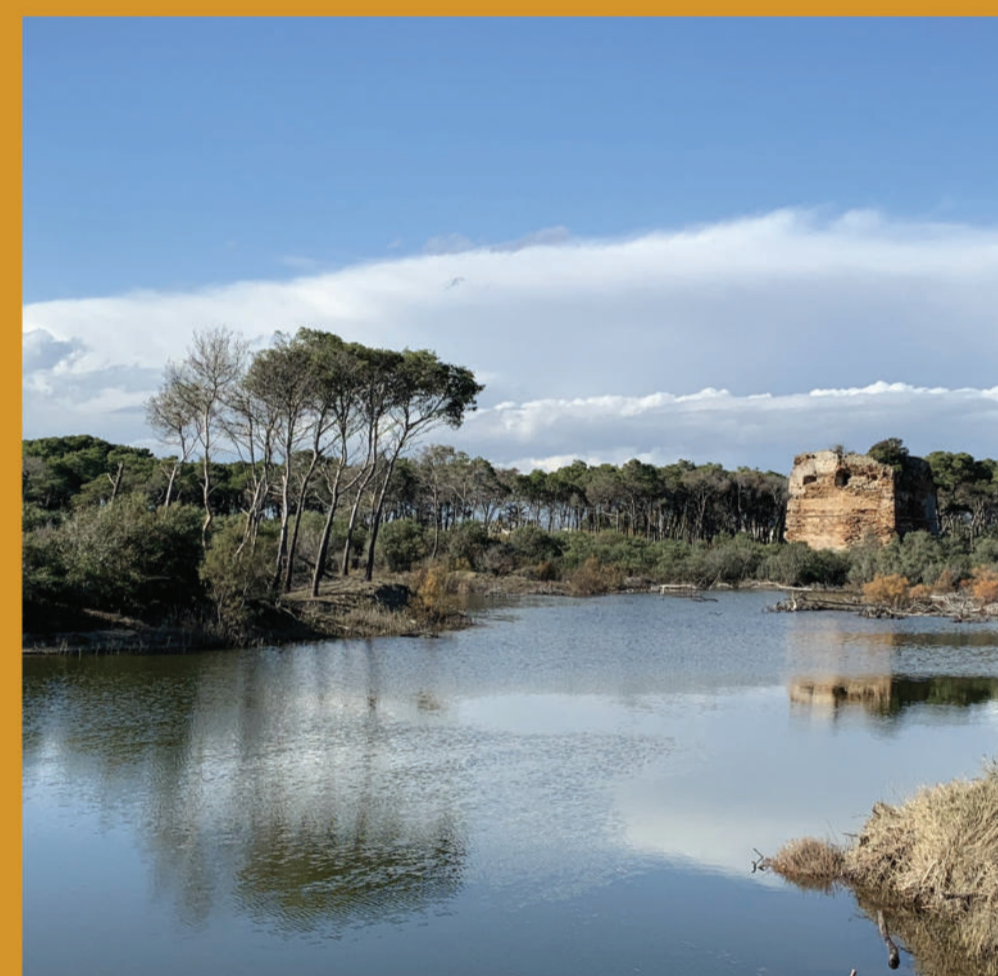
Marina di Ginosa, Torre "Mattoni" - Tower "Mattoni"