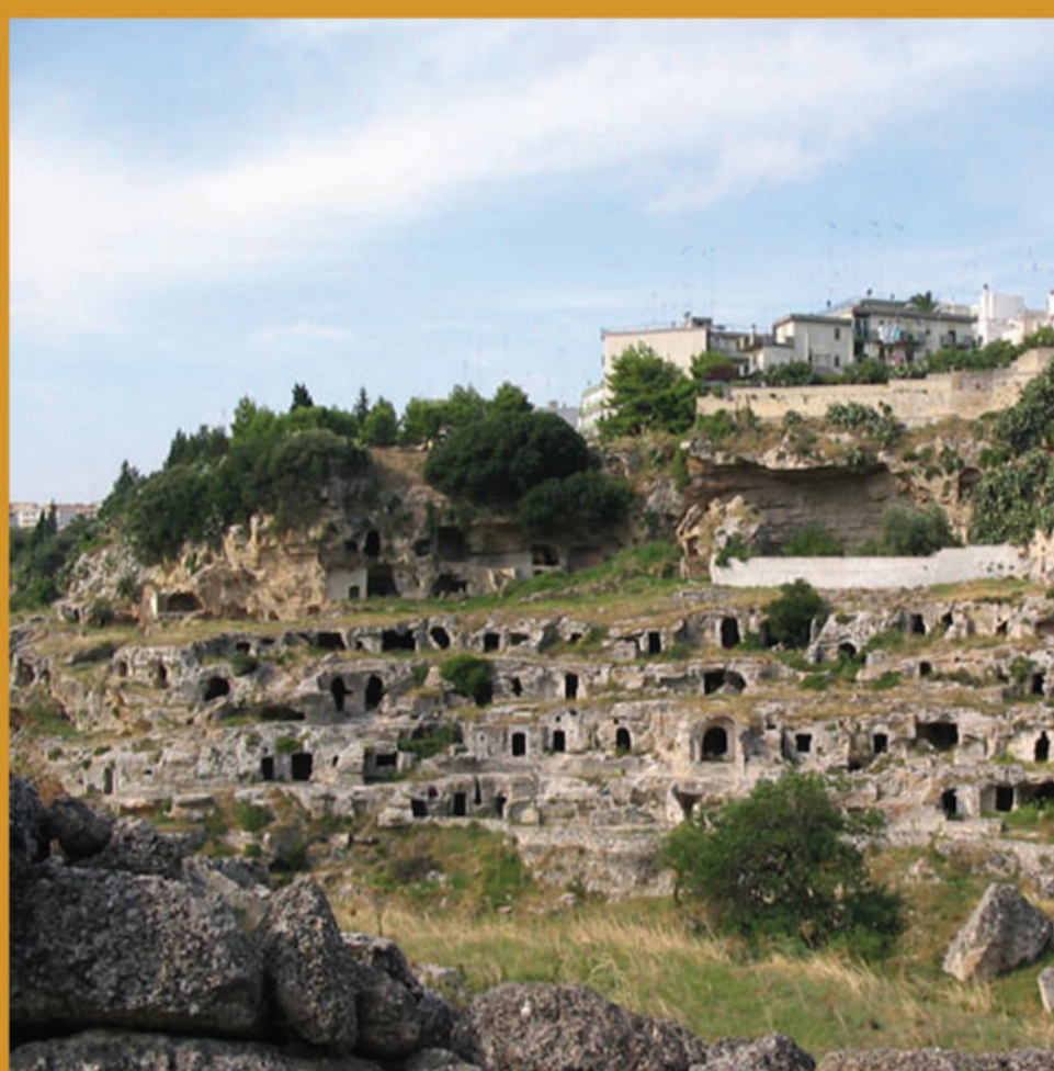
Villaggio rupestre "Rivolta" - Rock village "Rivolta"