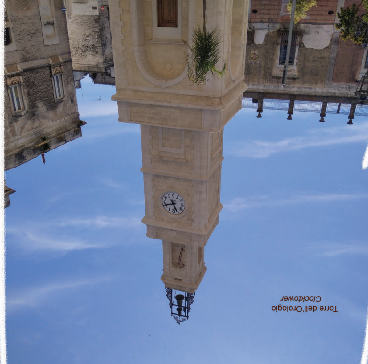
Torre dell'Orologio Clocktower