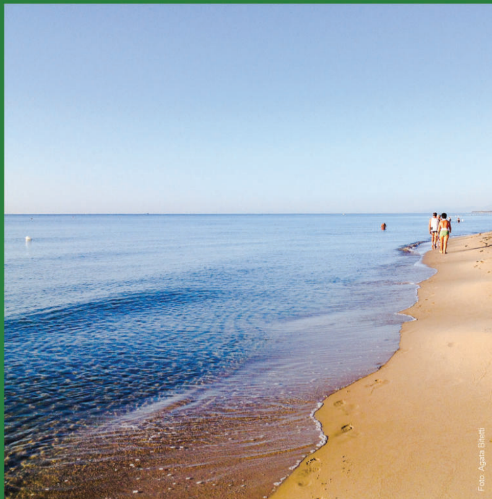
Marina di Ginosa, spiaggia - beach