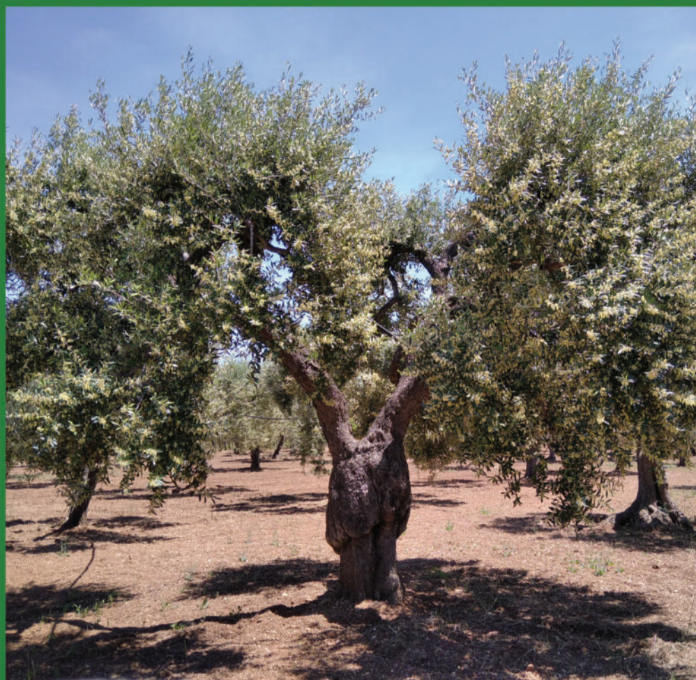
Uliveto - Olive trees