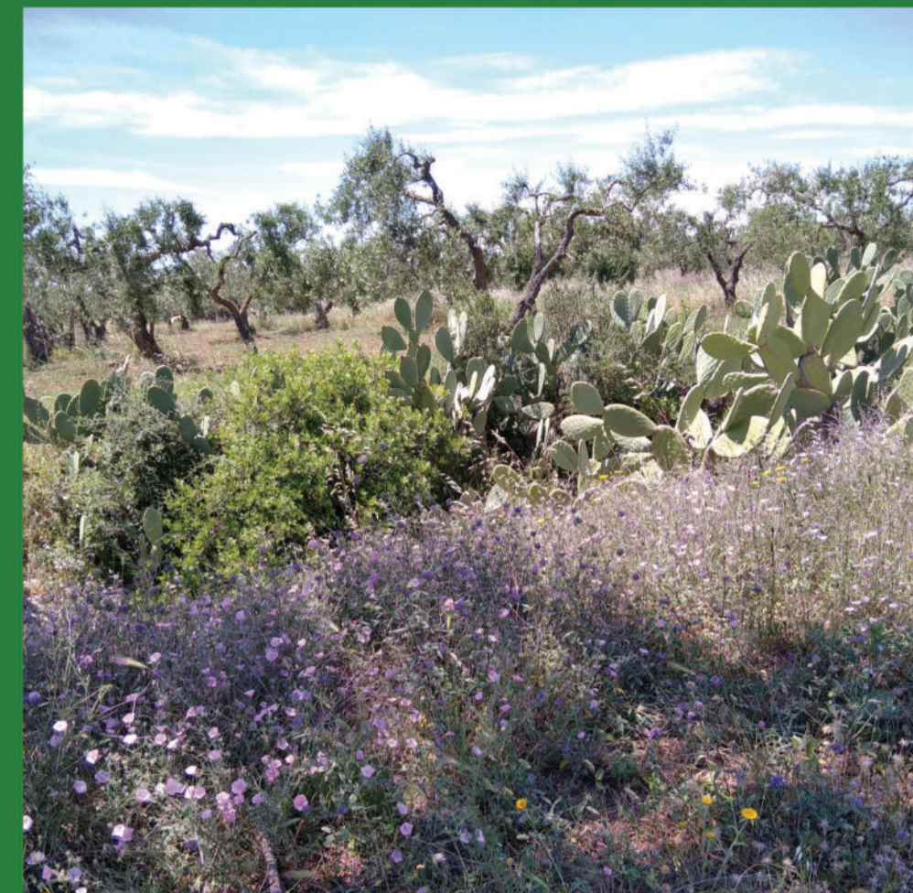
Uliveto, piante di fichi d'India e vegetazione spontanea Olive trees, plants of prickly pears and natural vegetation