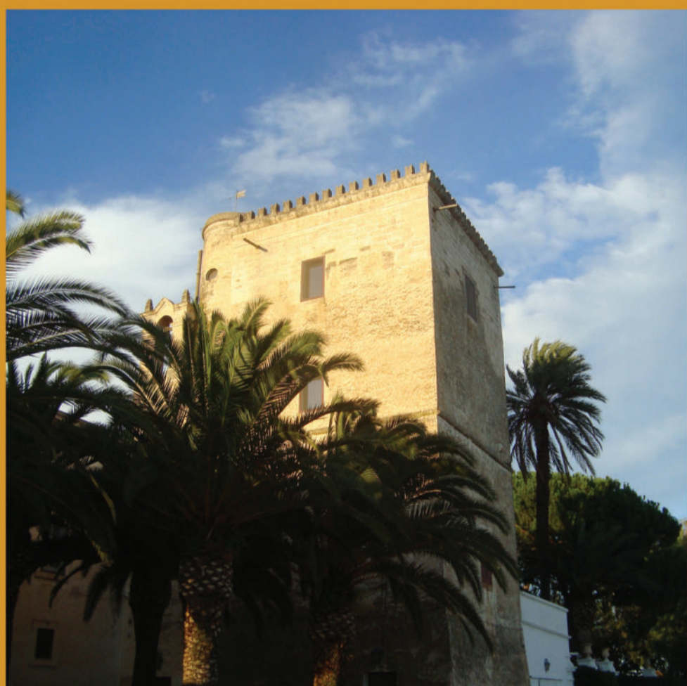
Masseria "Girifalco", Torre - Masseria "Girifalco", Tower