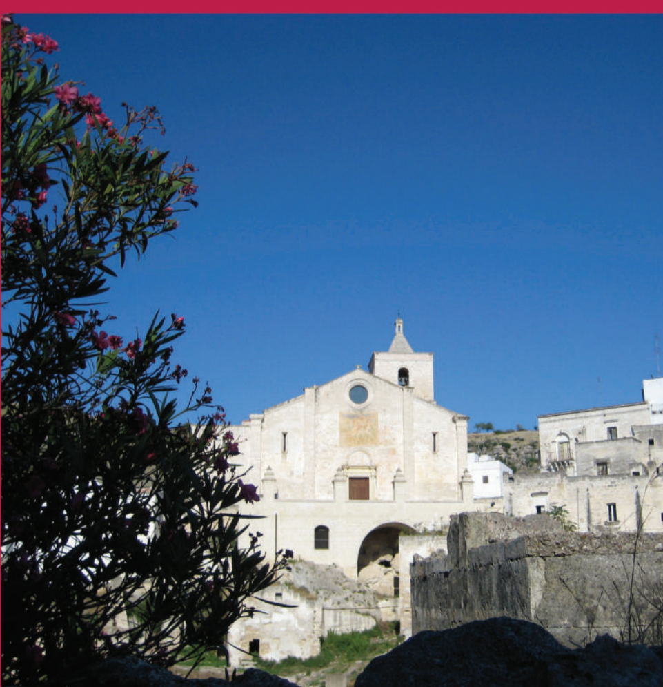
Chiesa Madre - Mother Church