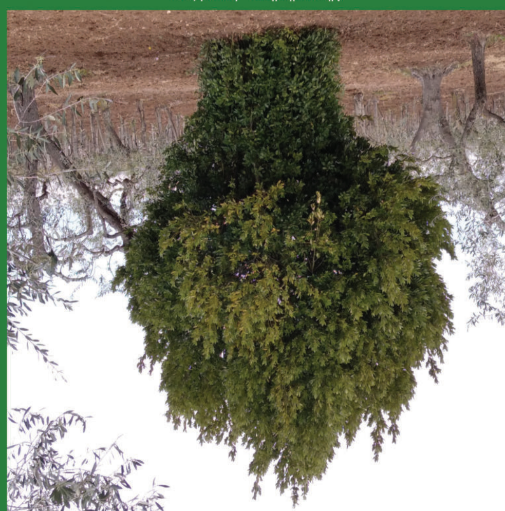
Albero di alloro - Laurel tree