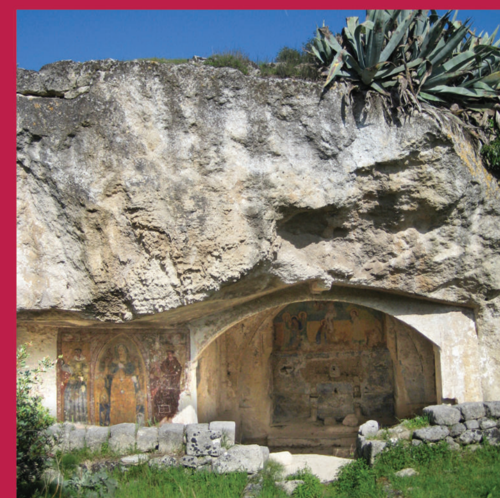
Chiesa rupestre di "S. Sofia", Crocifissione - Rock church of "Santa Sofia", Crucifixion