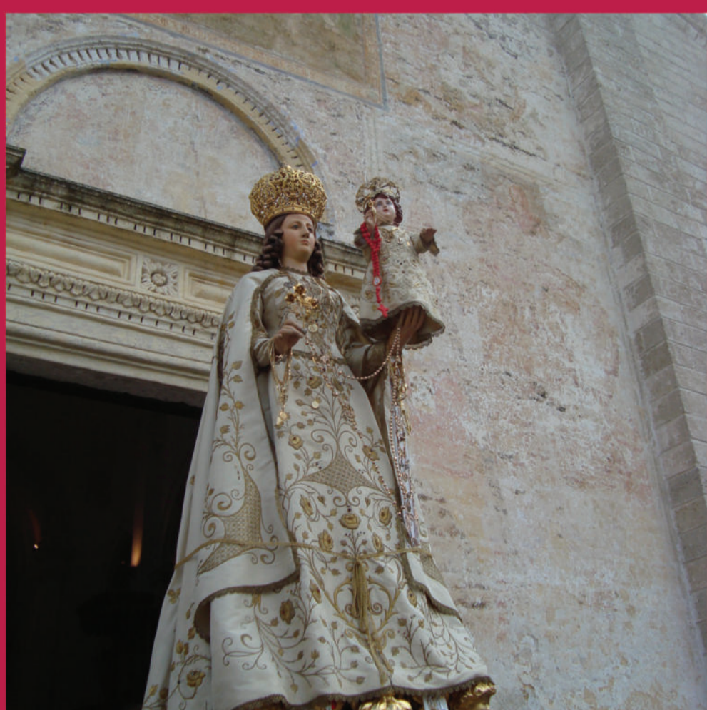
Madonna del Rosario - Our Lady of Rosary