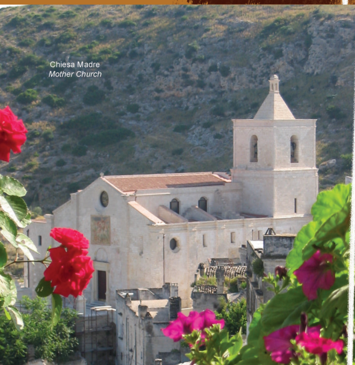
Chiesa Madre Mother Church